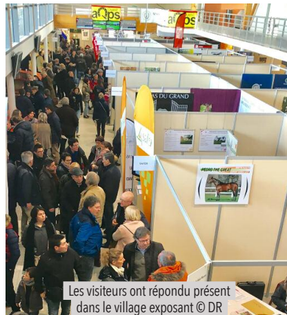
Les visiteurs ont répondu présent dans le village exposant