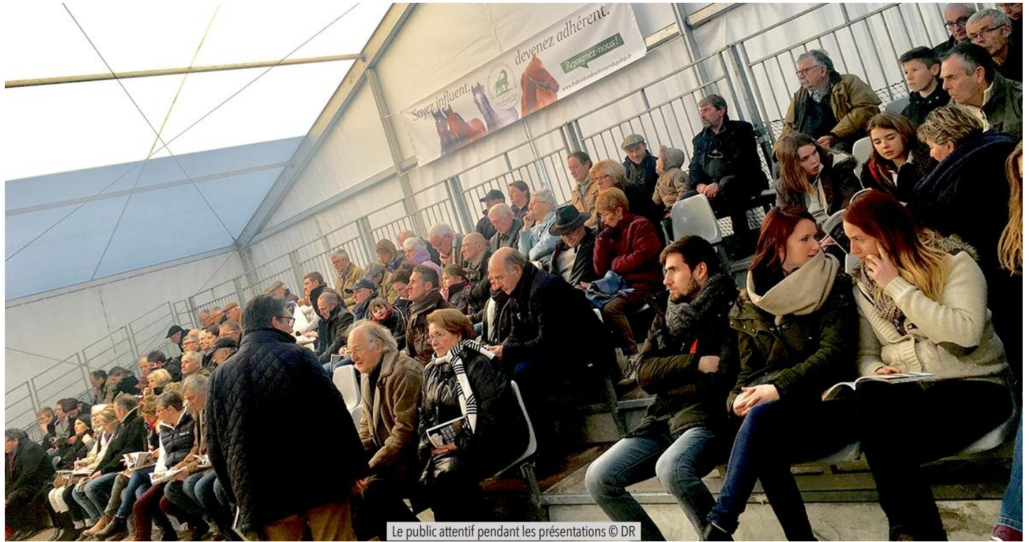
Le public attentif pendant les présentations