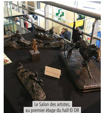
Le Salon des artistes, au premier étage du hall