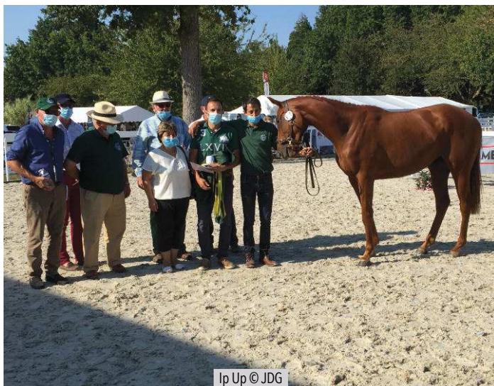
Ip Up

La famille d'Easysland à l'honneur. Dans la première section des 2ans, celle réservée aux femelles, c'est le numéro 68 qui s'est imposé. Il s'agit d' Ip Up (Secret Singer), présentée par l'association Vigneron-Lochin. C'est une nièce du champion de cross Easysland (Gentlewave) et de Sarisland (Martaline), gagnant du Prix Montgomery (Gr3). Elle a précédé le numéro 59, Incoast (Coastal Path), présentée par Couétil Élevage, et Italienne (Nombre Premier), du haras de Beaulieu.