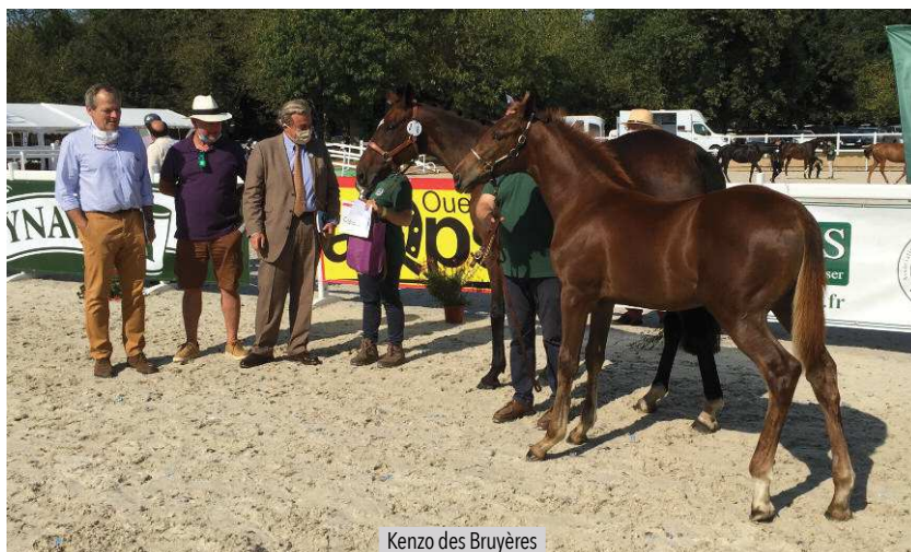
Kenzo des Bruyères

double gagnant de l'Anjou-Loire Challenge (L), et provenant donc de la famille de Mikador (Kadalko), deuxième du Prix Héros XII (Gr3). Plus loin dans sa souche, on retrouve le nom du champion Espoir d'Allen (Voix du Nord), gagnant du Champion Hurdle (Gr1), d' Envoi Allen (Muhtathir), double lauréat de Gr1 à Cheltenham, et d' Une Époque (Dom Alco), vainqueur du Prix Sytaj (Gr3). Soit une belle famille Vagne. ●●●